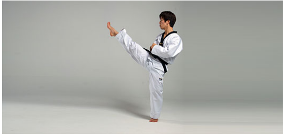
Ap Chagi (앞차기) - Vorwärts Kick