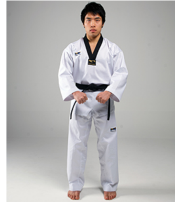
Junbi Seogi (준비서기) - Vorbereitende Stellung