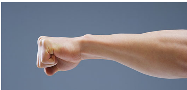
Momtong-Jireugi (몸통지르기) - Faustschlag