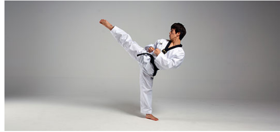
Dollyo Chagi (돌려차기) - Rund Kick

Kyorugi 겨루기 (Zweikampf): 1 Minute Zweikampf ohne Kontakt.