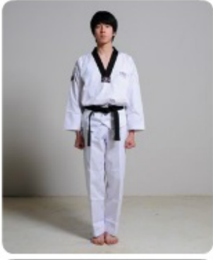
Chae-ryeot Seogi (차렷서기) - Achtung Stellung