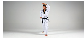
Olgul-Makki (얼굴막기) - Gesichts-Block