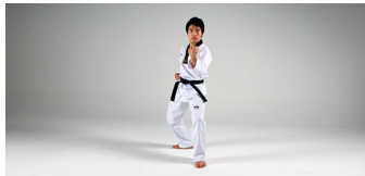
Momtong-Makki (몸통막기) - Oberkörper-Block