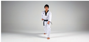
Arae-Makki (아래막기) - Unterleibszonen-Block